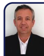
Cardin Depto. Cultural

Procure um curso de Direção Defensiva, invista na sua segurança !