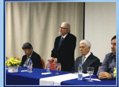
Nova mesa Diretoria